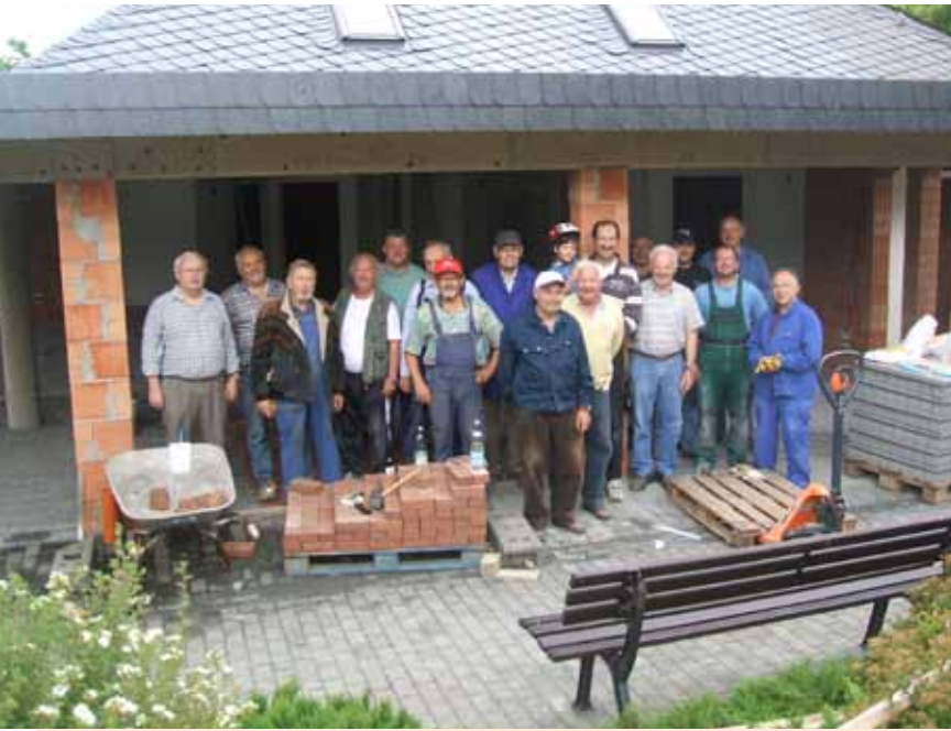
Gemeinsam packten Weidenhäuser und Volpertshäuser mit beim Umbau der Friedhofskapelle zwischen den Orten an.