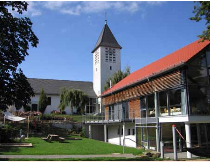
Ortsmittelpunkt von Vollnkirchen, das Bürgerhaus mit Spielgeräten und Sitzgelegenheiten sowie die Kirche.