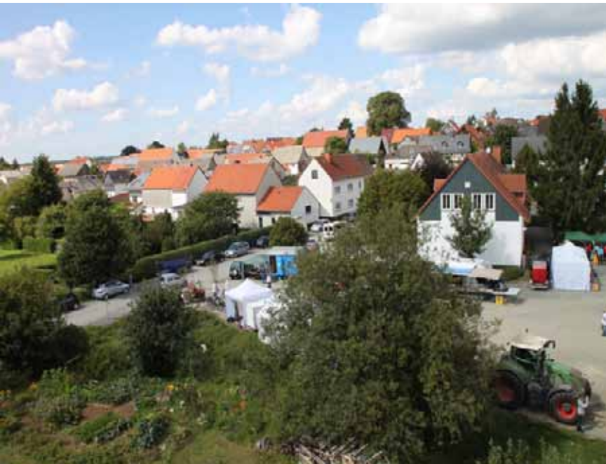
Blick auf den südlichen Teil von Reiskirchen mit Feuerwehr und Kirmesplatz